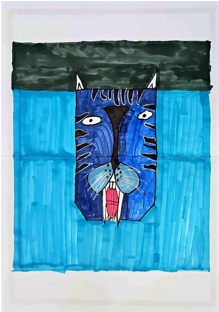
Linus Tausch, 11 Jahre

Platz 3 geht dieses Jahr an Linus Tausch. Sein abstraktes Bild eines Tigers fasziniert durch seine konstruktiv-geometrische Aufteilung und die lebendigen, intensiven Blautöne, die eine plakative Wirkung erzeugen. Die Verwendung von kräftigen Filzstiften verleiht dem Werk zusätzliche Tiefe und Intensität und trägt zu seiner herausragenden Präsenz bei. Linus bekommt für sein Werk einen Wunschgutschein im Wert von 100 Euro.