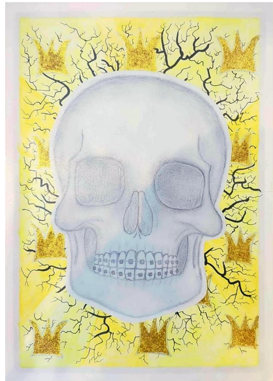
Zoe Rückauer, 15 Jahre „Kronprinz der Unterwelt“

Wir danken allen Teilnehmern für ihre kreativen Einsendungen und den damit verbundenen Aufwand. Alle, deren Werk dieses Mal nicht berücksichtigt wurde, laden wir herzlichst dazu ein, auch beim nächsten GrammArt Contest teilzunehmen und ihre Kreativität einzubringen.